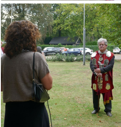
Een geschenk van de 'Seefeld'-groep voor de nieuwe koning!